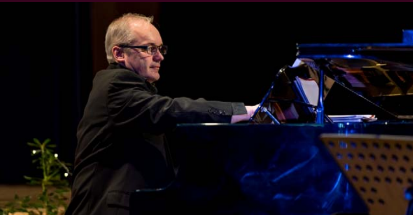
Accompagnateur au piano : Denis Poras