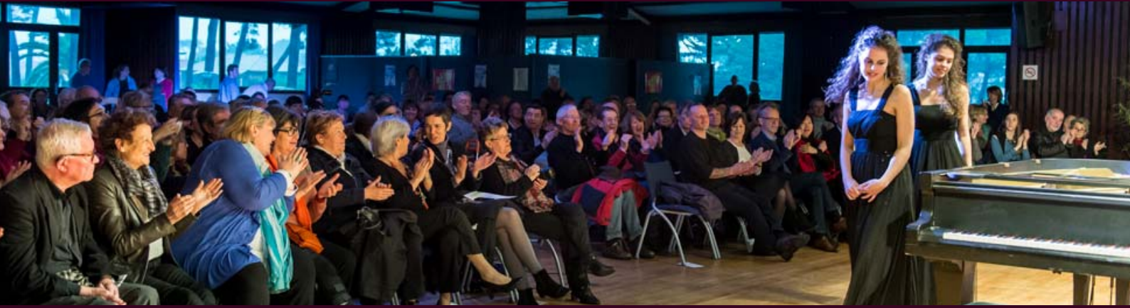
Le Zwilling's Duo (Allemagne) acclamé lors du concert de clôture.