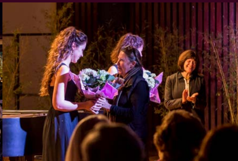
L'accueil chaleureux des bénévoles du Festival