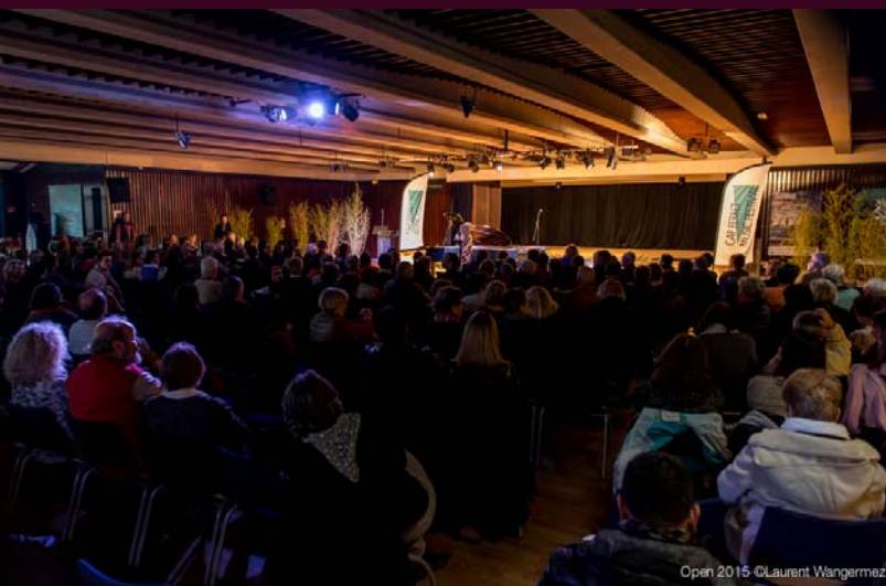
Plus de 300 personnes au rendez-vous